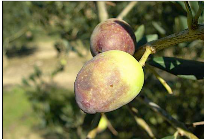
Symptômes de brunissement

La météo ne prévoit aucune chute des températures au cours des 15 jours à venir. Les dégâts risquent de s'aggraver sur les vergers encore légèrement touchés.