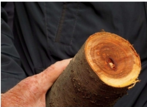
Galerie larvaire d' A. bungii dans le bois de cœur