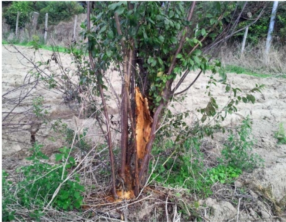
Arbre infesté par Aromia bungii avec des galeries larvaires dans le bois et de la sciure au pied.