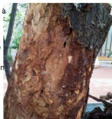
Galleries forées dans un tronc d'arbre par Aromia bungii

Les voies potentielles d'introduction sont le bois et les produits faits de bois, les matériaux d'emballage en bois et les plants de pépinières de Prunus spp.