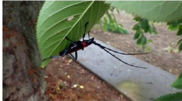
Aromia bungii adulte, face inférieure d'une feuille de Prunus spp.