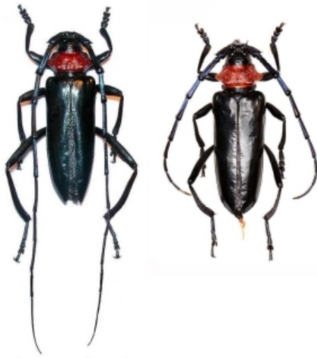
Aromia bungii stade adulte : mâle (à gauche) et femelle (à droite)