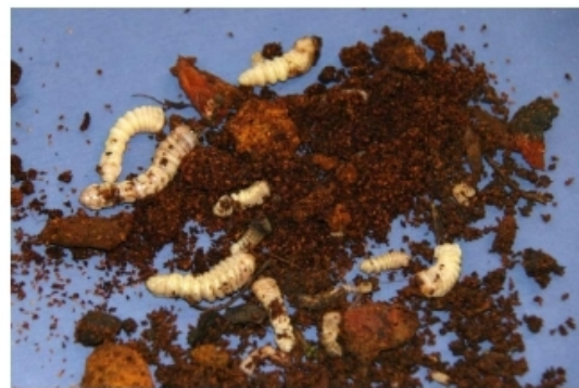
Larves d' A. bungii avec sciure