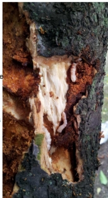
Galerias larvaires et déjections d' Aromia bungii associées à de la sciure dans un tronc d'arbre.

La présence de trous d'émergence de l'insecte adulte à la base du tronc (forme ovale, jusqu'à 16 mm de diamètre maximum) peut indiquer qu'une première génération a achevé son développement. Cependant, des larves vivantes peuvent encore être présentes dans le bois et émergeront une ou plusieurs années plus tard.