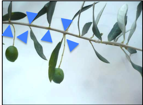
Cas n°2 : les feuilles de 2 ans sont présentes