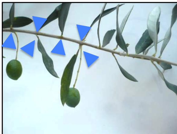
Cas n°2 : les feuilles de 2015 sont présentes