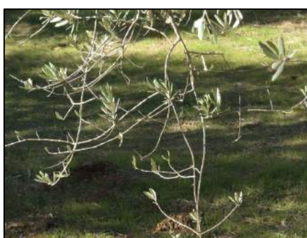
Défoliation due à l'œil de paon