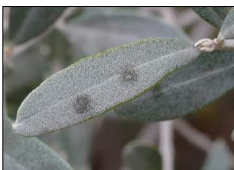
Jeunes taches d'œil de paon