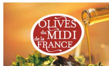
logotype sur fond image avec marge blanche