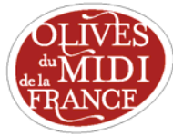
logotype sur fond blanc