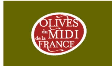
logotype sur fond foncé, avec marge blanche