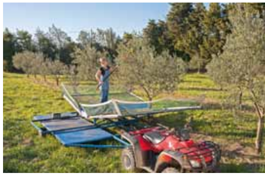
Récolte des olives