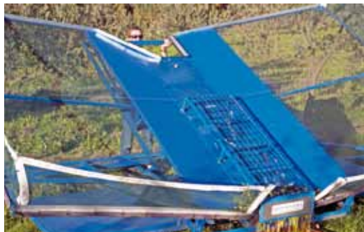
Récupération des olives