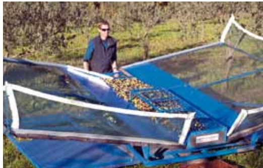
Basculement de la nacelle