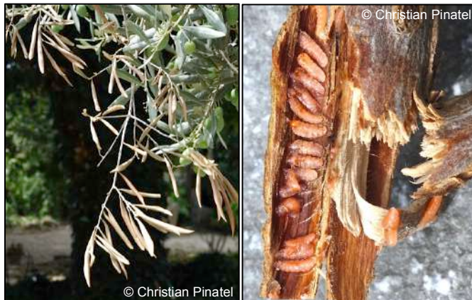
Dégâts et larve (asticot) de cécidomyie des écorces

Des dessèchements de branches sont actuellement observés dans certaines parcelles des Alpes-de-Haute-Provence et des Alpes-Maritimes. Certains oléiculteurs sont inquiets et pensent à Xylella .