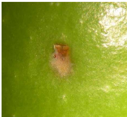
Grossissement piqûre de ponte de mouche de l'olive