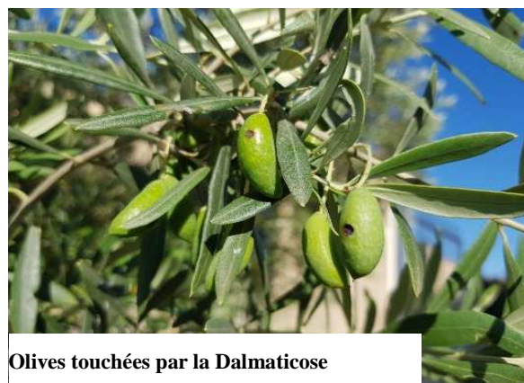
Olives touchées par la Dalmaticose

Posséder une méthode de lutte contre la mouche de l'olive efficace.