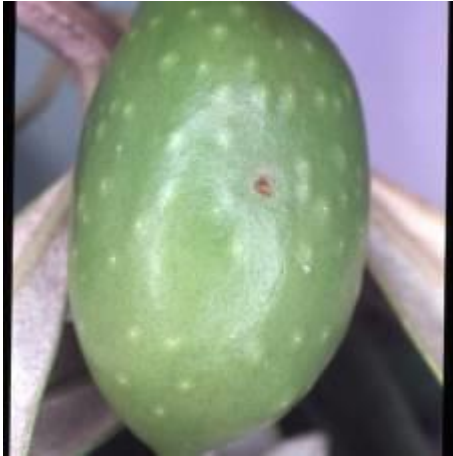
Piqûre de ponte de mouche de l'olive

Des piqûres de la mouche de l'olive sont observées. Il faut observer en détail (une loupe est utile) ces piqûres pour s'assurer qu'il s'agit bien de piqûres de mouche :