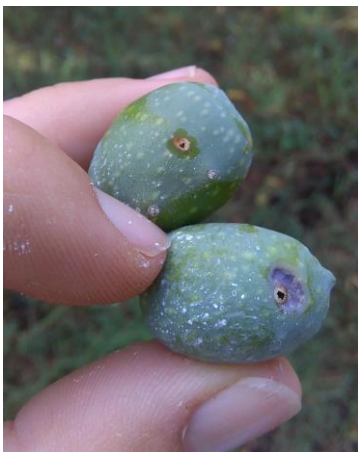
Trous de sortie observés dans le Var (CA 83)

Lorsque l'œuf a éclos, une galerie épaisse comme un cheveu est creusée dans la pulpe depuis le lieu de ponte par la jeune larve.