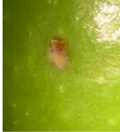
Grossissement piqûre de ponte de mouche de l'olive