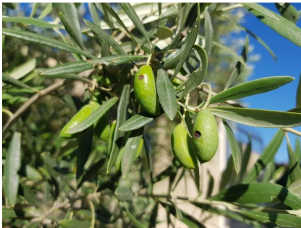
Olives touchées par la Dalmaticose (AFIDOL)

Son développement est fortement corrélé avec les piqûres d'insectes.