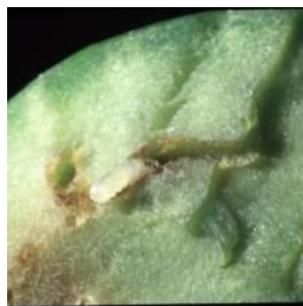
Trous de sortie observés dans le Var (CA 83)

Lorsque la larve a terminé son développement, elle creuse un trou de sortie avant d'entamer sa transformation en puppe puis en mouche.