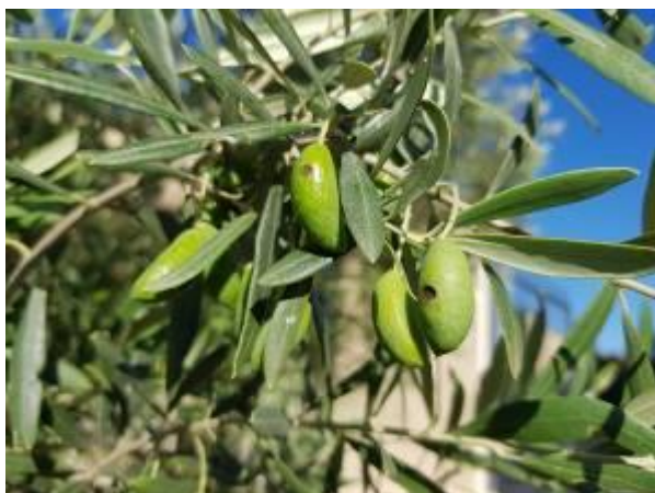
Olives touchées par la Dalmaticose (AFIDOL)

Son développement est fortement corrélé avec les piqûres d'insectes et les blessures sur le fruit (grêle).