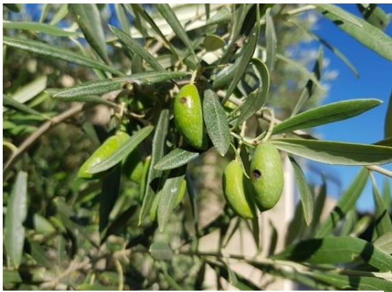
Olives touchées par la Dalmaticose (AFIDOL)

Son développement est fortement corrélé avec des piqûres d'insectes.