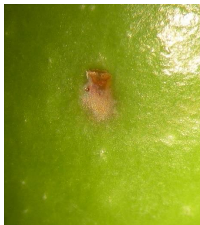
Grossissement piqûre de ponte de mouche de l'olive