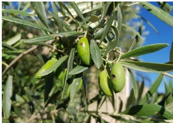
Olives touchées par la Dalmaticose (AFIDOL)

Son développement est fortement corrélé avec des piqûres d'insectes.