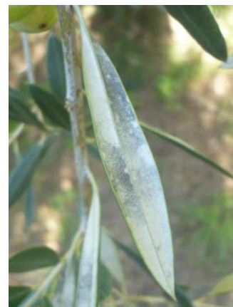
Taches grisâtres observées sur la face inférieure des feuilles (CTO)