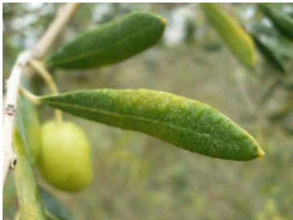
Symptômes observés sur la face supérieure des feuilles (CTO)