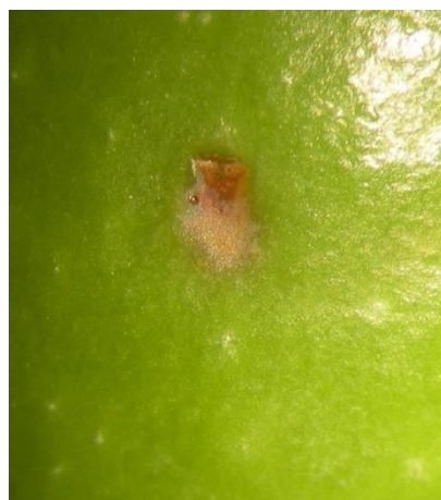
Grossissement piqûre de ponte de mouche de l'olive