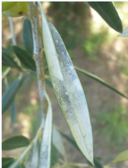
Tâches grisâtres observées sur la face inférieure des feuilles (CTO)