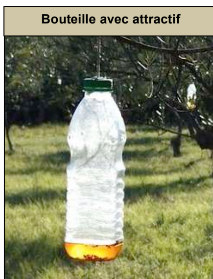
Bouteille avec attractif

Vous pouvez fabriquer vous-même et installer dans votre parcelle dès maintenant un système de piégeage attractif, à l'aide de bouteilles en plastique transparent, contenant une solution de phosphate diammonique. Ces captures permettent de limiter la population de mouches.