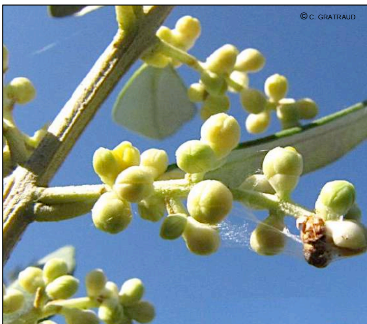
Inflorescence d'olivier au stade « boutons blancs » avec dégâts précoces de teigne (à droite sur la photo)

Pour être efficace les spécialités à base de Bacillus thuringiensis doivent être ingérées par les chenilles de teigne : il faut donc mouiller suffisamment le feuillage pour bien atteindre toutes les feuilles. Il faut généralement prévoir plus de 600 L/ha, et qu'il fasse beau dans les jours qui suivent l'application. S'il pleut ou s'il fait froid, renouvelez l'application une semaine ou 10 jours plus tard.