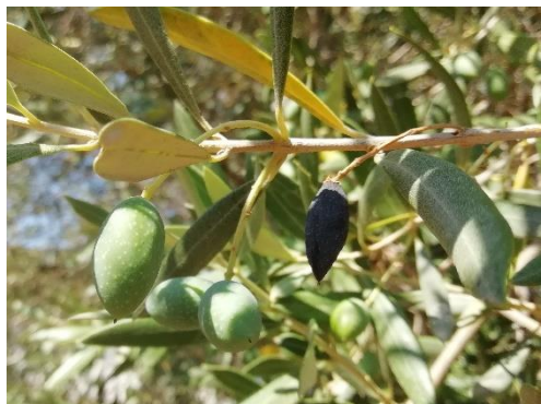
Chute physiologique

De manière générale, les olives, toutes variétés confondues, ont atteint les 1cm de longueur, sauf dans l'arrière-pays des Alpes-Maritimes. Sur variété précoce, comme la Salonnenque, le noyau commence à durcir.