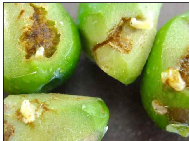
Larves de mouches observées à Cassis (13)