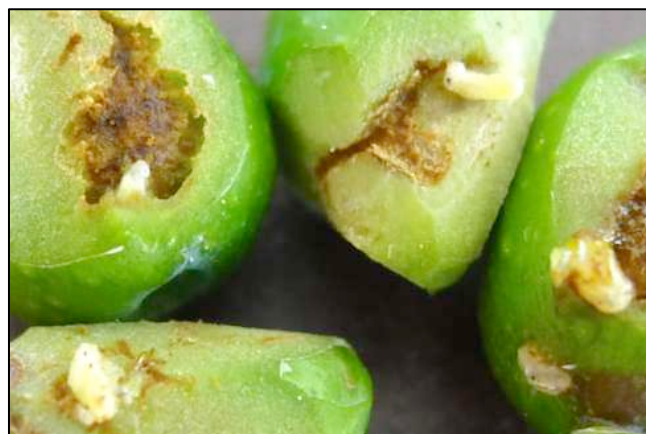
Larves de mouches observées à Cassis (13)