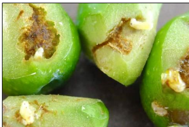
Larves de mouches observées à Cassis (13)