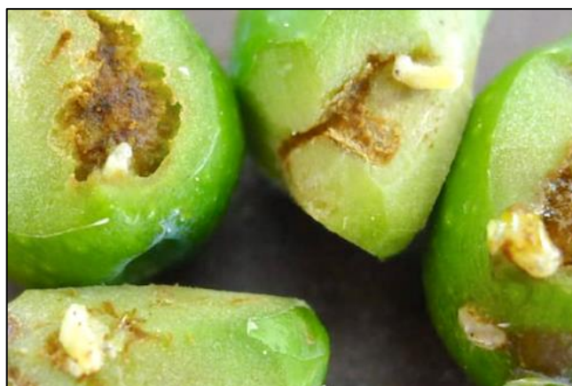
Larves de mouches observées à Cassis (13)

Attention ! Chaque année, à partir du 15 août, le risque d'attaque augmente fortement : soyez vigilant, et préparez dès maintenant votre stratégie de lutte en surveillant la météo, la rémanence de la dernière protection appliquée, l'importance du vol et le niveau des dégâts dans la parcelle.