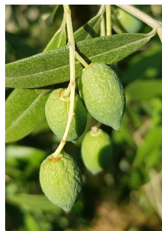
Olives fripées

Les premières olives fripées sont observées en vergers non irrigués.