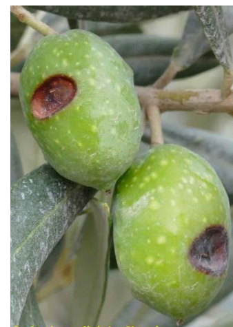
Symptômes sur fruits caractéristiques de la dalmaticose