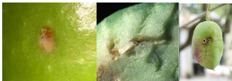
Symptômes visibles de l'évolution d'une piqûre de mouche : de gauche à droite, piqûre de ponte, galerie larvaire, trou de sortie

Les premiers trous de sortie ont été observés dans les Bouches-du-Rhône.